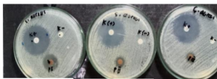
PI (Kombinasi 80% : 20%) PII (Kombinasi 50% : 50%) PIII (Kombinasi 20% : 80%)