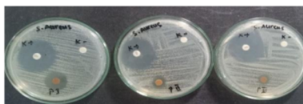
PI (Kombinasi 80% : 20%) PII (Kombinasi 50% : 50%) PIII (Kombinasi 20% : 80%)