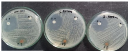
PI (Kombinasi 80% : 20%) PII (Kombinasi 50% : 50%) PIII (Kombinasi 20% : 80%)