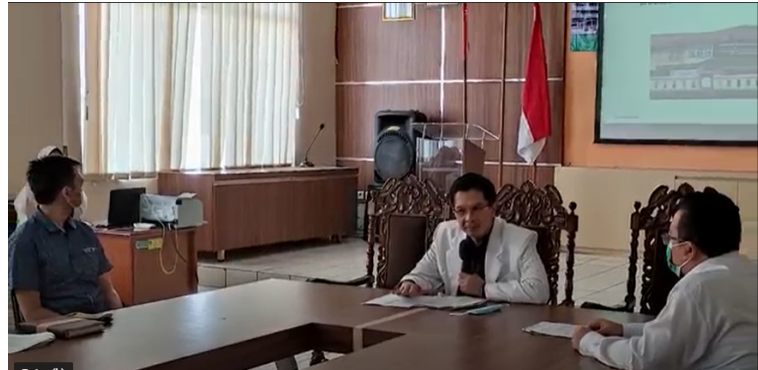
Gambar 4. Arahan dari Ketua Komite Medis RSUD Dr. Soekardjo Kota Tasikmalaya